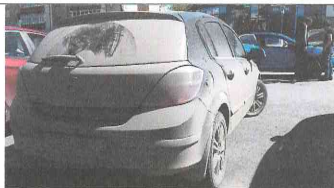
Внешний вид автомобиля