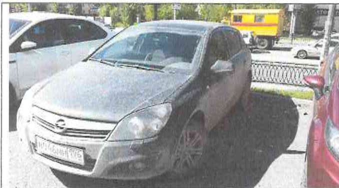
Внешний вид автомобиля