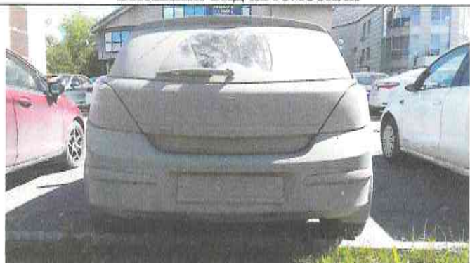
Внешний вид автомобиля