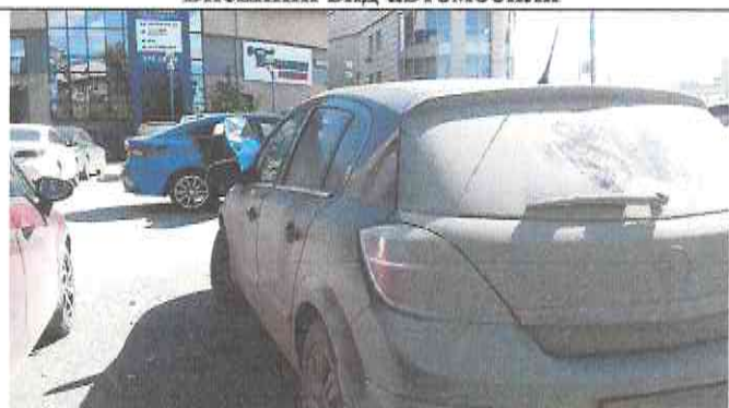
Внешний вид автомобиля